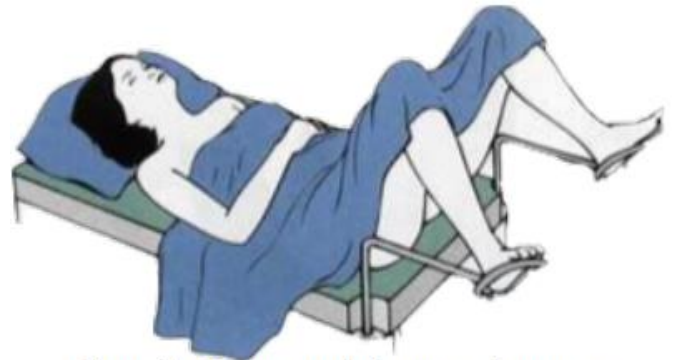
Figure 15 : Position gynécologique « classique »

Vient ensuite l'examen gynécologique à proprement parler. La position classique d'examen dans nos sociétés occidentales est celle des pieds dans les étriers. La femme, dont le bas du corps est dénudé, s'allonge en plaçant son postérieur le plus au bord de la table possible et ses pieds dans des étriers, la/le praticien-ne se plaçant entre les jambes de la patiente. Cette position permet à la/au gynécologue un « accès » facile à son sexe et facilite l'examen. Ce confort n'est par contre pas toujours réciproque. Si certaines femmes ne ressentent pas de gêne dans cette position, de nombreuses autres ne sont pas à l'aise, pouvant se sentir en quelque sorte « offertes » à la/au praticien-ne 5 .